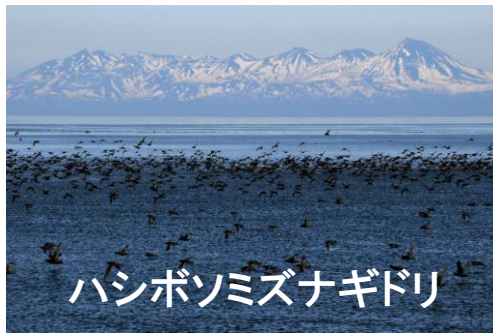
ハシボソミズナギドリ